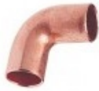
Kolana 90° jednokielichowe