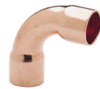
Łuki 90° dwukielichowe