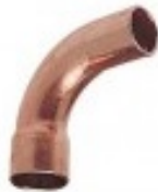
Łuki 90° jednokielichowe