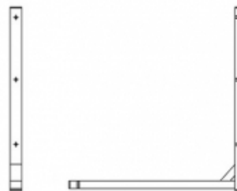
Wsporniki typu WS ze stężeniem dolnym